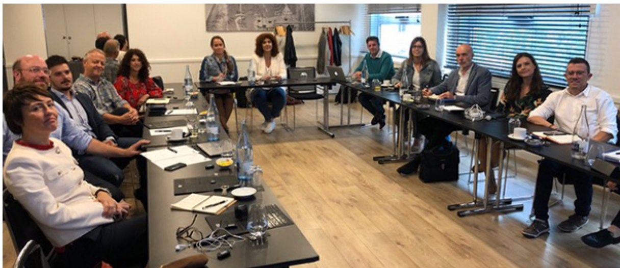
Comité Extraordinario de C!Print. De izquierda a derecha:

También se acordó el enfoque de los principales ejes de C!Print para el próximo año, fruto de una voluntad de permanente dinamismo y adaptación, junto al mercado, y como consecuencia del éxito de esta recién clausurada edición.