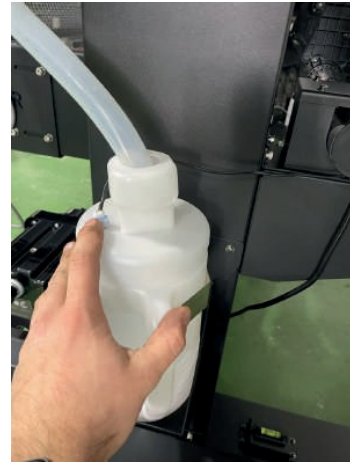
Bote residual con sensorde nivel